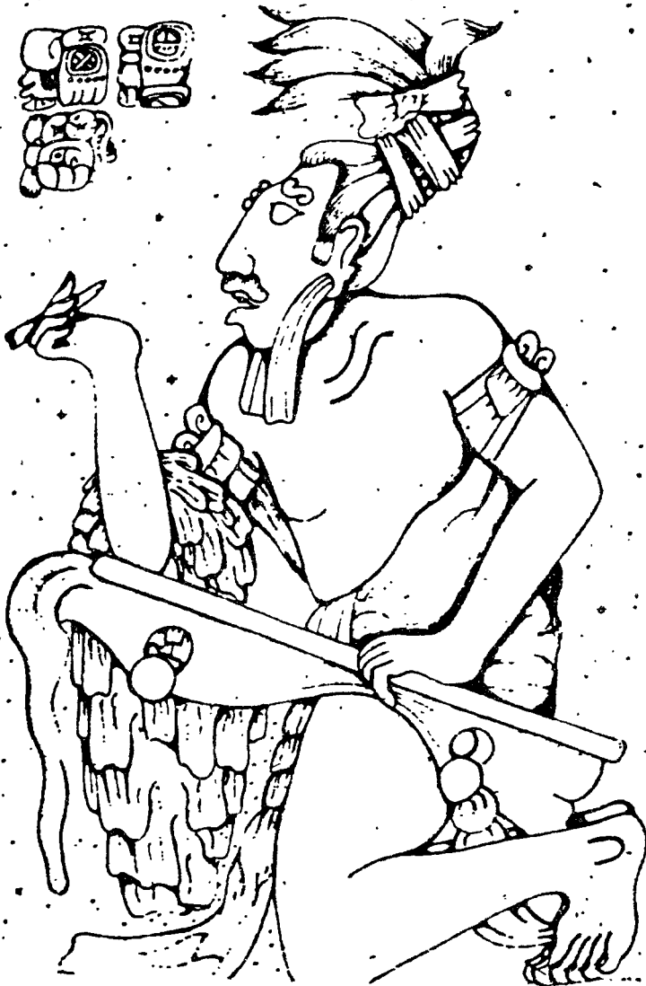
EL ESCRIBA ESTELA DE LOS FRISOS DE PALENQUE